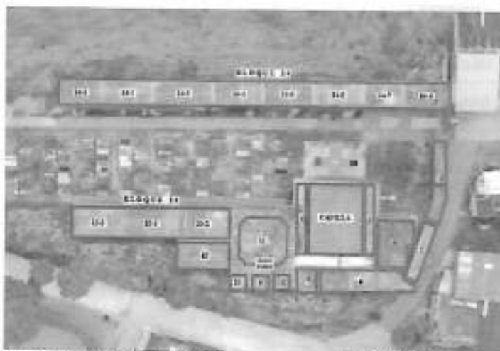
Foto 3 - Imagen aérea donde se observan las 14 unidades constructivas para inhumación del Cementerio San Agustín, 13 de ellas correspondientes a columbarios y 1 correspondiente al osario común (número 11). Tomado de: Diagnóstico UJA.

Según la Unidad de Investigaciones y Acusaciones de la JEP, el cementerio de San Agustín cuenta con 14 unidades constructivas, 13 de ellas correspondientes a columbarios y 1 correspondiente al osario común (número 11). Tomado de: Diagnóstico UJA.