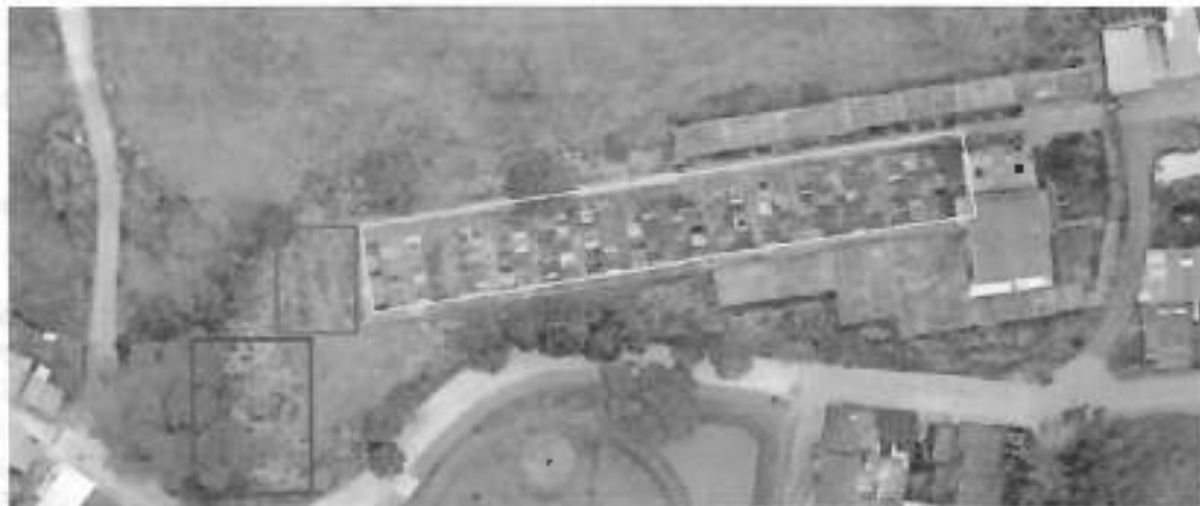
Foto 4 - Imagen aérea del cementerio San Agustín donde se observan los tres sectores destinados para la inhumación en tierra.

Continuación de la Resolución: "Por medio de la cual se autorizan labores humanitarias y extrajudiciales de prospección y recuperación de cuerpos y estructuras óseas humanas por parte de la UBPD, en el Cementerio San Agustín de Samaná (Caldas), en cumplimiento del mandato de búsqueda de personas dadas por desaparecidas"